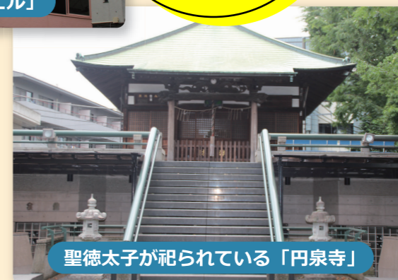
聖徳太子が祀られている「円泉寺」