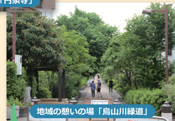
地域の憩いの場「烏山川緑道」