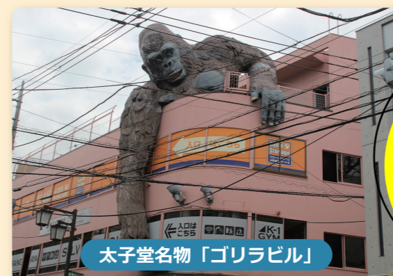
太子堂名物「ゴリラビル」